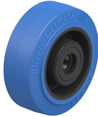
Roue utilisée POEV 80/12R-SB