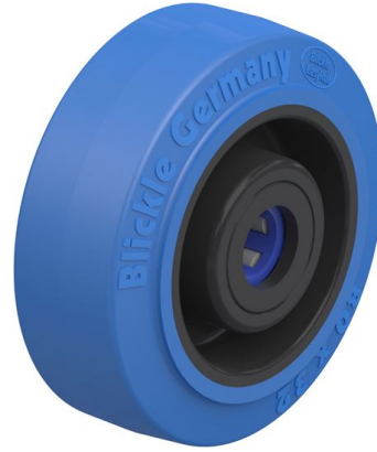
Roue utilisée POEV 80/12XR-SB