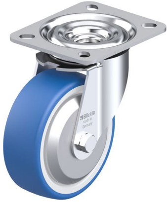
Roulette pivotante correspondante L-POTHS 100G-FA