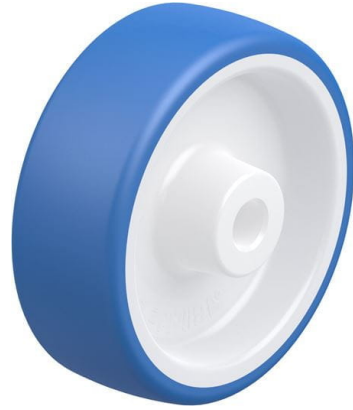
Roue utilisée POTH 100/12G