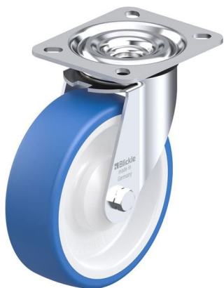
Roulette pivotante correspondante L-POTHS 125KA