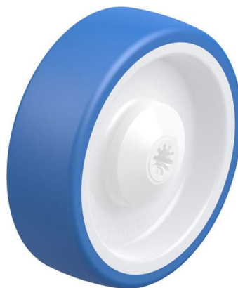
Roue utilisée POTHS 125/8KA