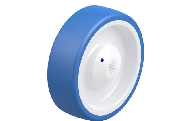
Roue utilisée POTHS 125/8XKA