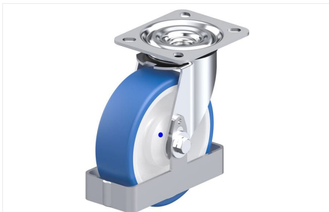
Roulette pivotante correspondante L-POTHS 125XKA-FS