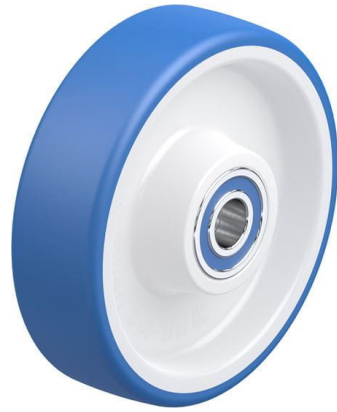
Roue utilisée POTHS 160/20XK