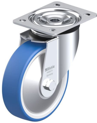
Roulette pivotante correspondante L-POTHS 160XK-FA