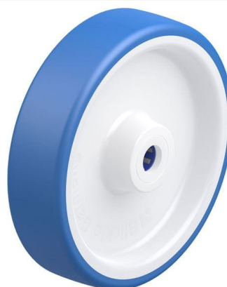
Roue utilisée POTHS 200/20XR