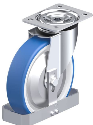
Roulette pivotante correspondante L-POTHS 200XR-FA-FS