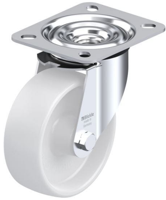
Roulette pivotante correspondante LE-PO 100G