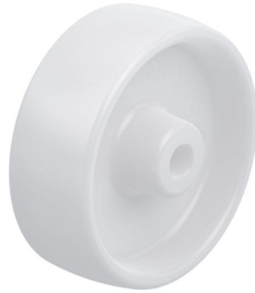
Roue utilisée PO 100/12G