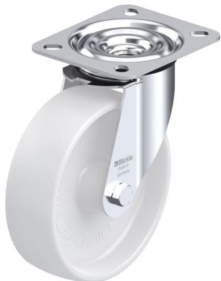
Roulette pivotante correspondante LE-PO 125G