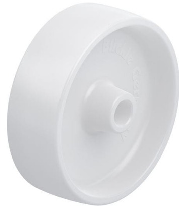
Roue utilisée PO 150/20G