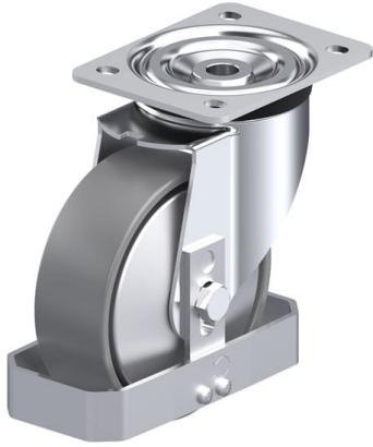
Roulette pivotante correspondante L-PO 150G-ELS- FA-FS