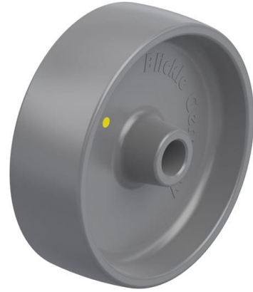
Roue utilisée PO 150/20G-ELS