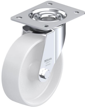
Roulette pivotante correspondante LE-PO 160G