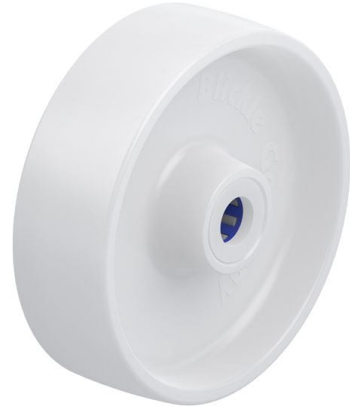
Roue utilisée PO 160/20XR