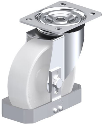
Roulette pivotante correspondante L-PO 160XR-FS