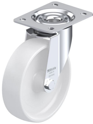
Roulette pivotante correspondante LE-PO 175G