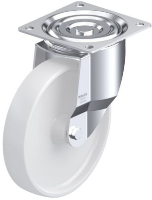
Roulette pivotante correspondante L-PO 250G