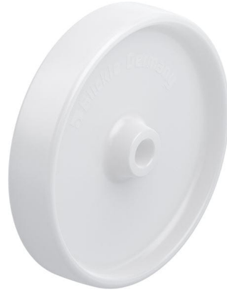
Roue utilisée PO 250/25G