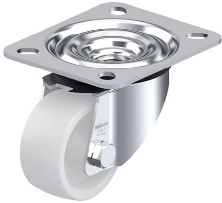
Roulette pivotante correspondante LE-PO 60G