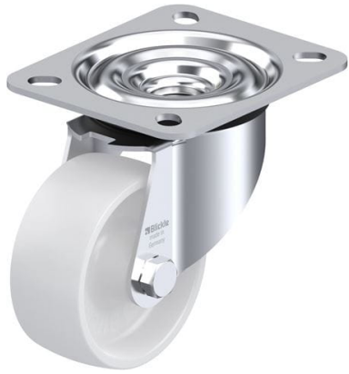
Roulette pivotante correspondante LE-PO 75G