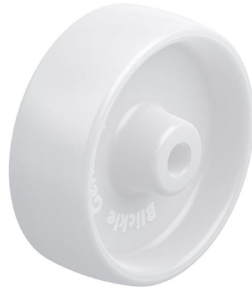
Roue utilisée PPN 100/12G