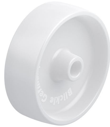
Roue utilisée PPN 150/20G