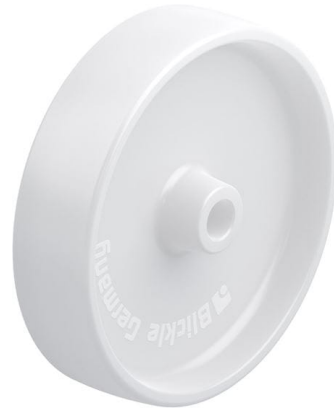
Roue utilisée PPN 200/20G