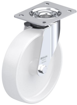
Roulette pivotante correspondante LE-PPN 200G