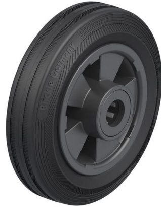
Roue utilisée VPP 150/20R