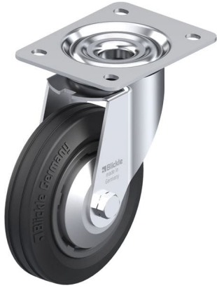
Roulette pivotante correspondante LE-VPP 150R-FA