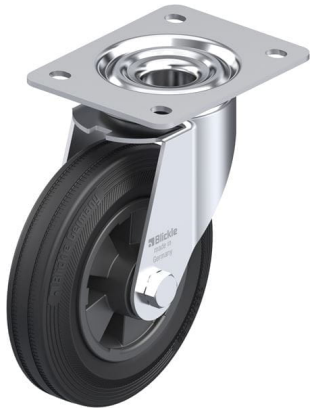
Roulette pivotante correspondante LE-VPP 160R