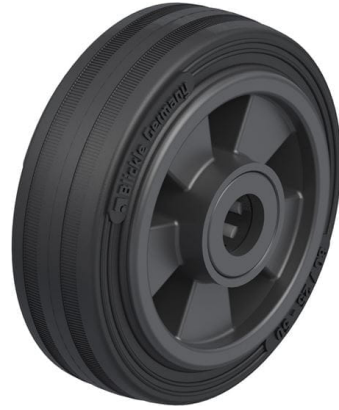
Roue utilisée VPP 80/12R