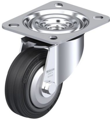
Roulette pivotante correspondante L-VPP 80R-FA