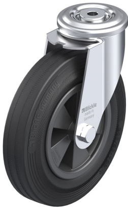
Roulette pivotante correspondante LER-VPP 200G