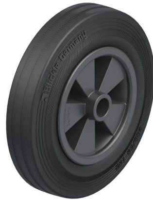
Roue utilisée VPP 200/20G