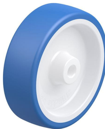
Roue utilisée POTHS 125/12G