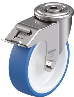
Blocage standard associé LEXR-POTHS 125G-FI