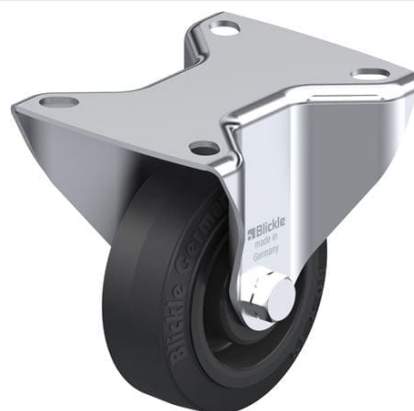
Roulette fixe correspondante B-POEV 80R