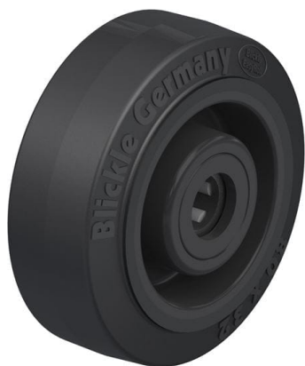
Roue utilisée POEV 80/12R