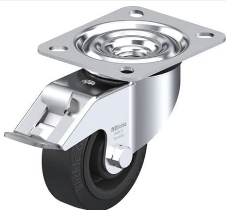
Blocage standard associé LE-POEV 80R-FI