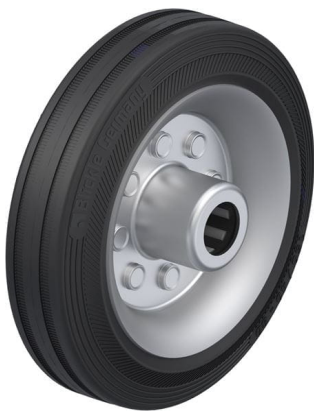
Roue utilisée VE 150/20R