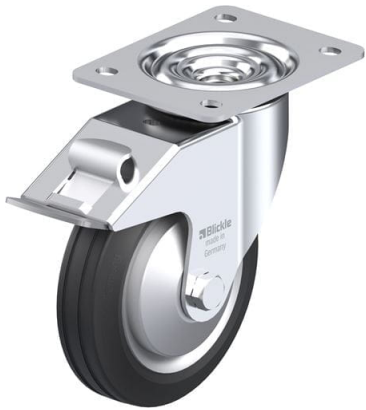
Blocage standard associé LE-VE 150R-FI-FA