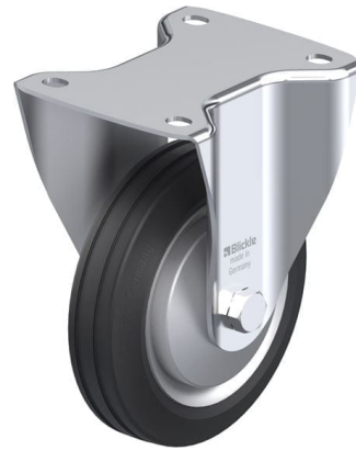
Roulette fixe correspondante B-VE 150R-FA