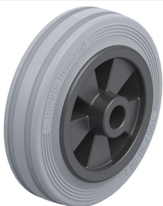
Roue utilisée VPP 100/12G-SG