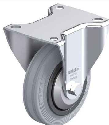
Roulette fixe correspondante B-VPP 100G-SG-FA