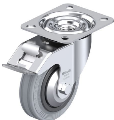
Blocage standard associé LE-VPP 100G-FI-SG-FA