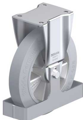
Roulette fixe correspondante BH-ALEV 250K-SG-FS