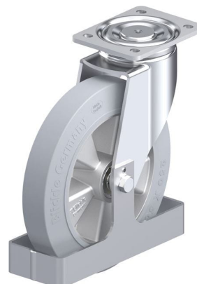
Roulette pivotante correspondante LH-ALEV 250K-SG-FS