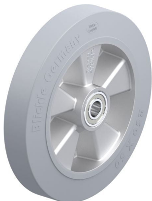
Roue utilisée ALEV 250/20K-SG