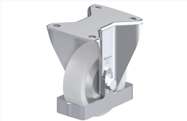
Roulette fixe correspondante BH-SPO 125G-3-FA-FS