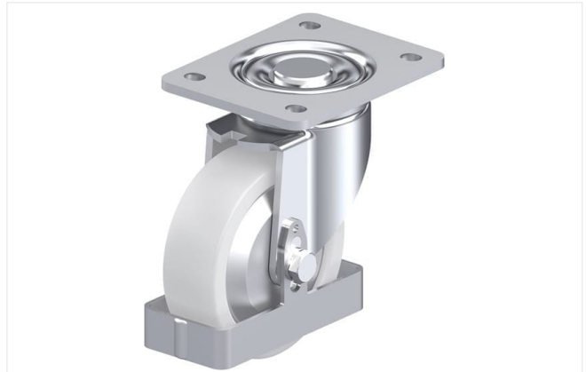
Roulette pivotante correspondante LH-SPO 125G-3-FA-FS