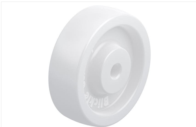
Roue utilisée SPO 125/15G