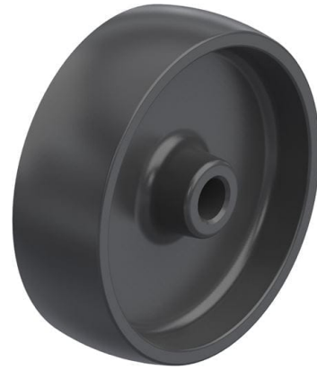
Roue utilisée POA 100/12G