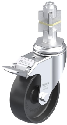
Blocage standard associé LKRA-POA 100G-11-FI-E17