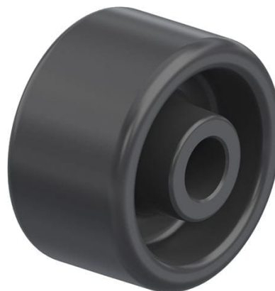
Roue utilisée POA 52/12G