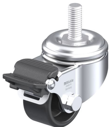
Blocage standard associé LKRA-POA 52G-RA-GS12