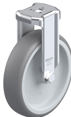
Roulette fixe correspondante BKRA-TPA 126G