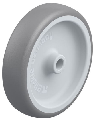
Roue utilisée TPA 126/12G