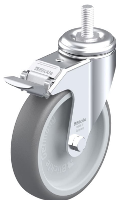
Blocage standard associé LKRA-TPA 126G-FI-GS12