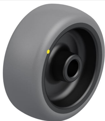
Roue utilisée TPA 80/12G-ELS