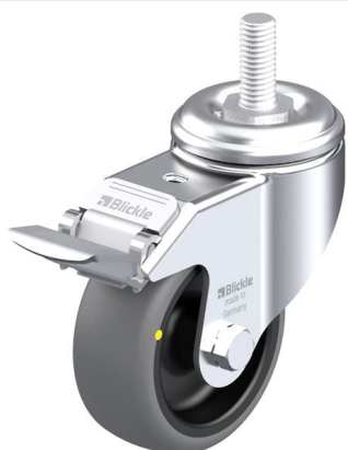
Blocage standard associé LKRA-TPA 80G-FI-ELS-GS12