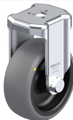
Roulette fixe correspondante BKRA-TPA 80G-ELS