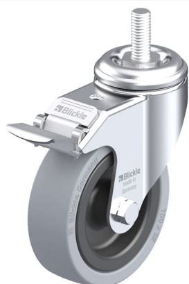
Blocage standard associé LKRA-VPA 101G-FI-GS12