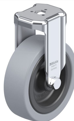
Roulette fixe correspondante BKRA-VPA 101G