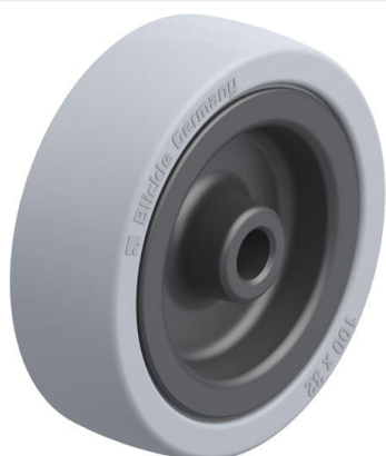
Roue utilisée VPA 101/12G