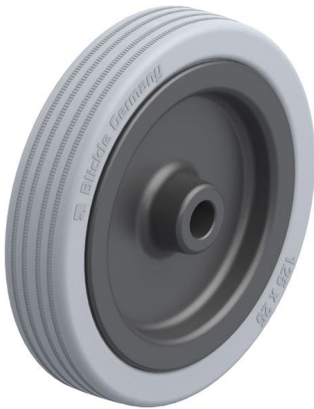
Roue utilisée VPA 125/12G