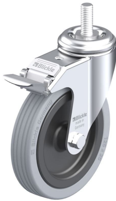
Blocage standard associé LKRA-VPA 125G-FI-GS12