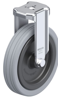
Roulette fixe correspondante BKRA-VPA 125G