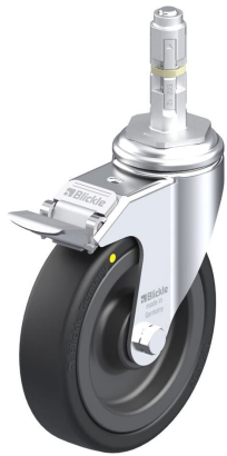
Blocage standard associé LKRA-VPA 126K-11-FI-EL-E12