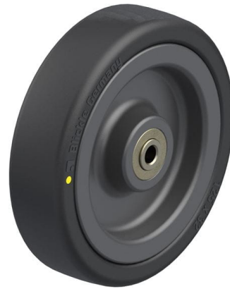
Roue utilisée VPA 126/8K-EL