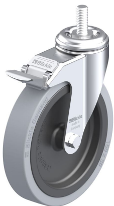
Blocage standard associé LKRA-VPA 150G-FI-GS12