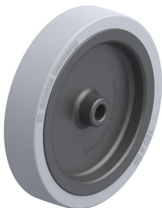
Roue utilisée VPA 150/12G