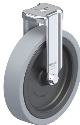
Roulette fixe correspondante BKRA-VPA 150G