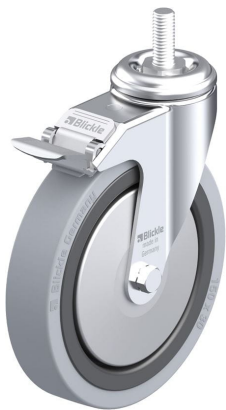
Blocage standard associé LKRA-VPA 150K-FI-FA-GS12