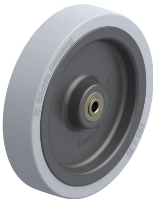
Roue utilisée VPA 150/8K