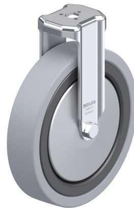
Roulette fixe correspondante BKRA-VPA 150K-FA