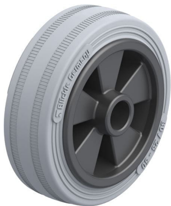
Roue utilisée VPA 80/12G