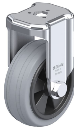
Roulette fixe correspondante BKRA-VPA 80G