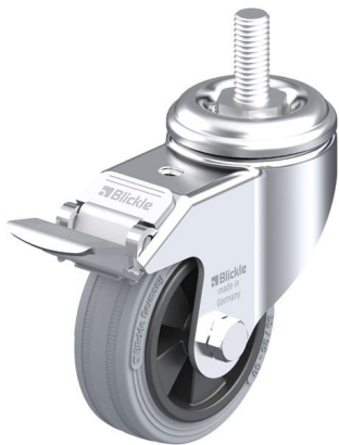
Blocage standard associé LKRA-VPA 80G-FI-GS12