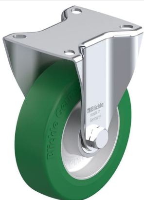
Roulette fixe correspondante BK-ALST 125K-1