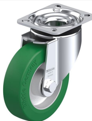
Roulette pivotante correspondante LK-ALST 125K-1