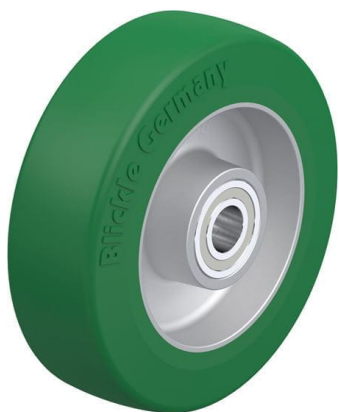
Roue utilisée ALST 125/15K