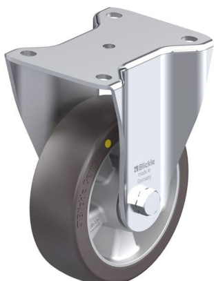
Roulette fixe correspondante BH-ALST 150K-AS