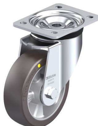
Roulette pivotante correspondante LK-ALST 150K-AS