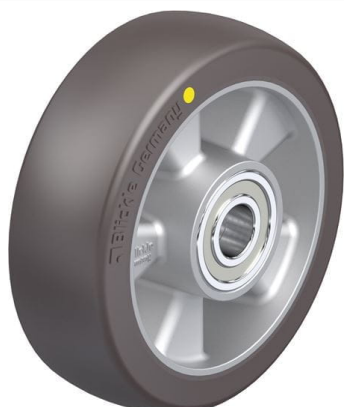
Roue utilisée ALST 150/20K-AS