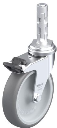
Blocage standard associé LRA-TPA 100G-FI-E01