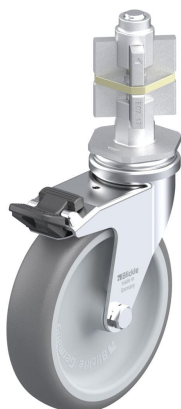
Blocage standard associé LRA-TPA 100G-FI-E07