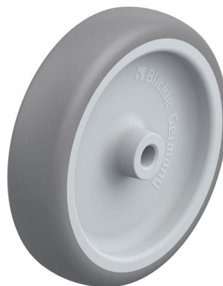
Roue utilisée TPA 100/8G