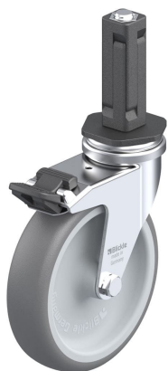
Blocage standard associé LRA-TPA 100G-FI-EV02