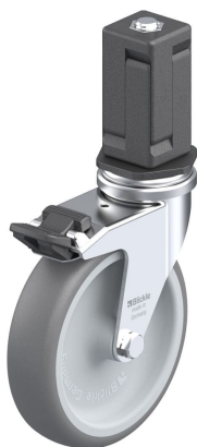
Blocage standard associé LRA-TPA 100G-FI-EV05