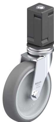
Roulette pivotante correspondante LRA-TPA 100G-EV07