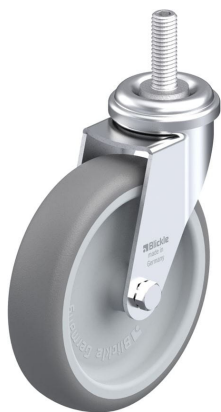
Roulette pivotante correspondante LRA-TPA 100G-GS10