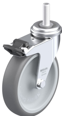
Blocage standard associé LRA-TPA 100G-FI-GS10